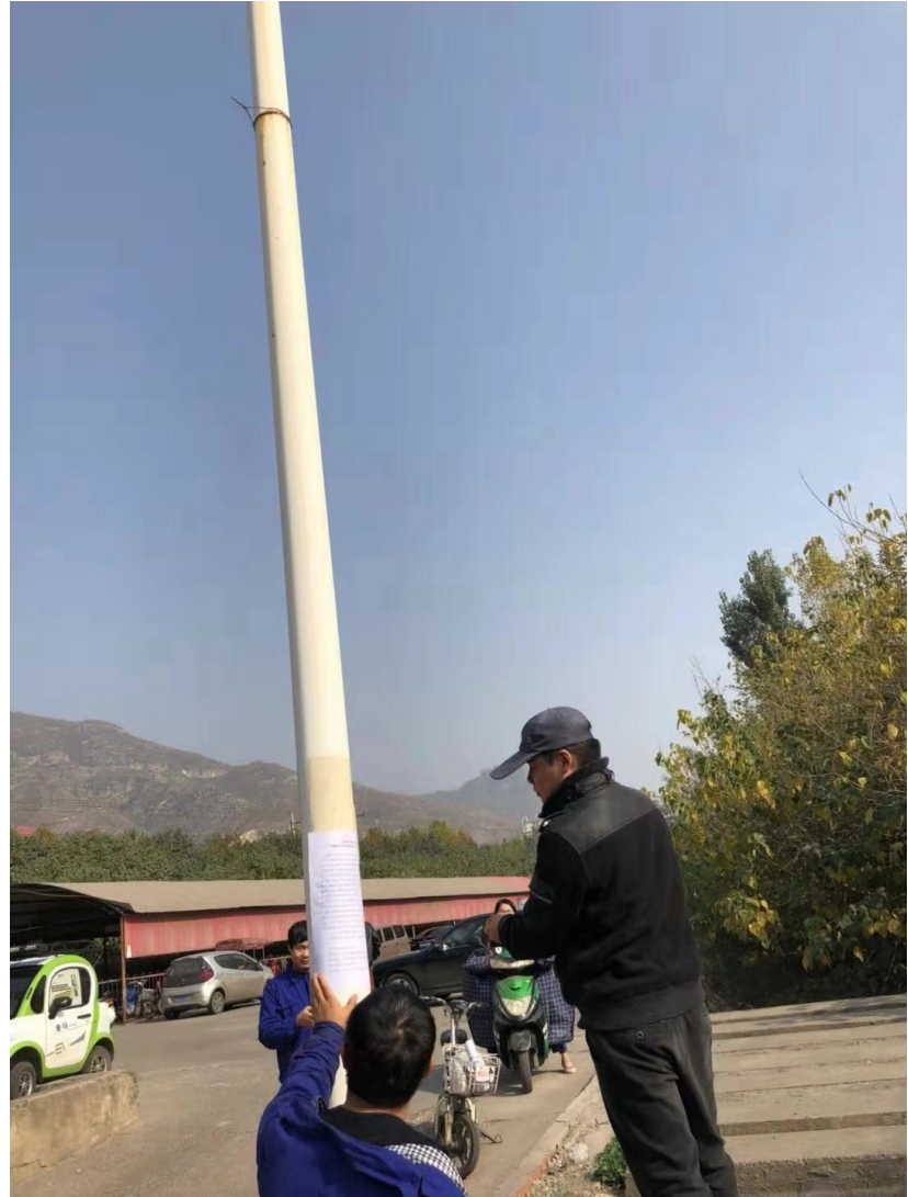
附图 5 工程竣工及调试日期的公示照片