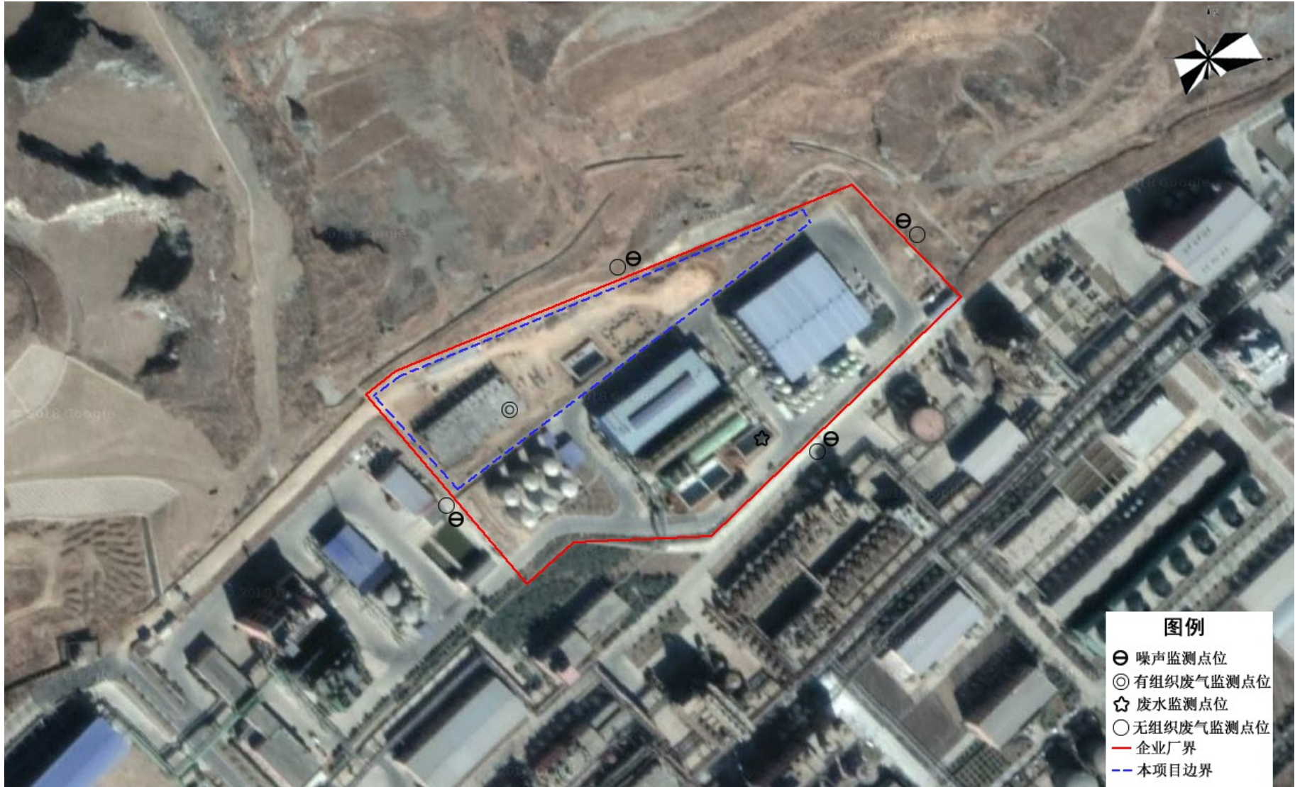
附图3 厂区平面布置及污染源监测点位示意图